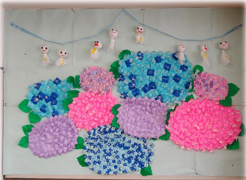
あじさいとてるてる坊主（利用者様の作品）

デイサービスサンライフ明日香では、利用者様が住み慣れた地域で末永く生活を続けられるよう、「やりたいことが出来るように」を目標に運動機能向上、生活機能の維持・向上を目指すサポートをさせていただきます！！